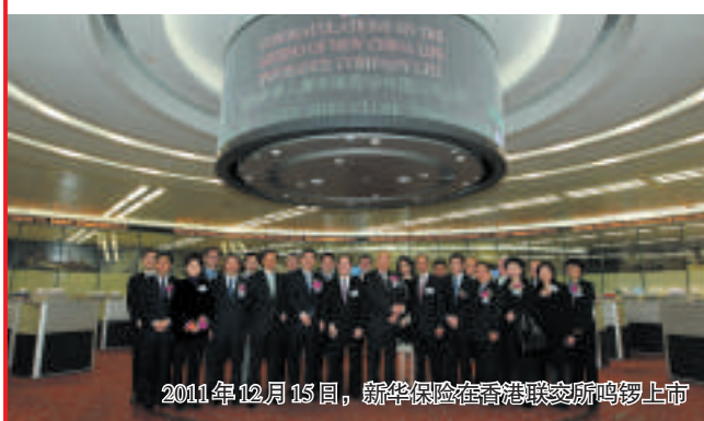
2011年12月15日，新华保险在香港交易所鸣锣上市