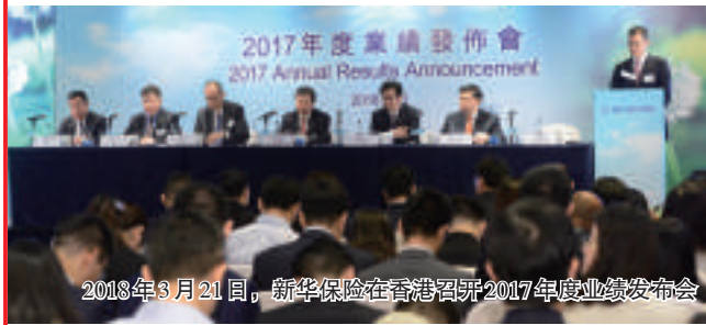
2018年3月21日，新华保险在香港召开2017年度业绩发布会

十六载的高效服务，让新疆分公司以《都市消费晨报》“疆耀梦想”年度金融行业评选之“最佳保险营销服务团队”“年度优秀保险服务满意度企业”，《乌鲁木齐晚报》“风尚之巅”年度金融行业评选之“年度最受信赖寿险公司”“年度最受消费者欢迎寿险品牌”著称。荣誉的背后，是新华保险新疆分公司的实力和不懈努力。