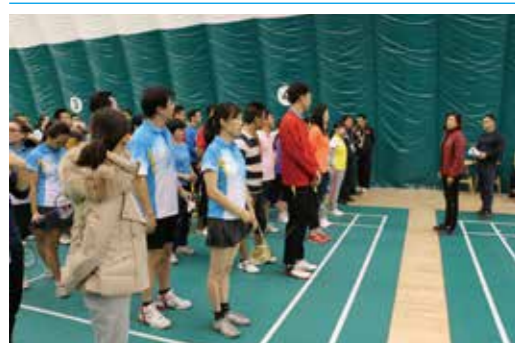
案例：新华保险总公司机关工会举办第七届羽毛球赛

为丰富员工业余文化生活，展示员工风采，引导广大员工培养和拓展积极向上的情趣和爱好，弘扬中国传统文化，提升艺术修养，努力构建文化型企业，推进全新华文化的落地，公司成立了摄影爱好者协会、书画爱好者协会等群众性团体，并邀请专家开展相关讲座交流活动。此外，公司还因地制宜地组织员工参加篮球、足球等球类项目和游泳、瑜伽、健身操、太极拳等健身俱乐部的活动，同时还通过组织员工运动会，举办羽毛球赛、乒乓球赛等赛事，增强员工的体魄，活跃员工的业余文体生活。